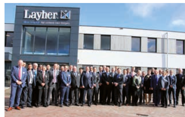
Global general managers op bezoek ter ere van heropening 2017