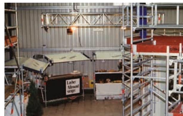
De showroom midden jaren 90

Met Ad Suijkerbuijk ging Layher Benelux een nieuwe periode in. Met een volledig nieuw managementteam werd er verder gebouwd aan het vergroten van de omzet en het marktaandeel. Er werden regelmatig trips naar de fabriek gepland met klanten. In 1996 werd succesvol het 25-jarig bestaan van Layher gevierd met een groot feest. Hierbij waren ongeveer 600 mensen aanwezig. In 1999 werd besloten om een locatie in België te openen om zo ook in België en Luxemburg dicht bij de klanten te zijn. Na veel zoekwerk kwam de eerste locatie in Kessel in beeld als tijdelijke oplossing. Hier werd een opslagterrein gehuurd waar een tweetal kantoorunits op werden geplaatst. De omzet zowel in Nederland als in België ontwikkelde zich zeer positief. Ad Suijkerbuijk ging in 2011 met pensioen en werd opgevolgd door René Lijzenga . Geen onbekende in de branche. Pas in 2014 (over tijdelijk gesproken) viel het besluit om de Belgische locatie te verhuizen naar een nieuwe locatie in Kontich.