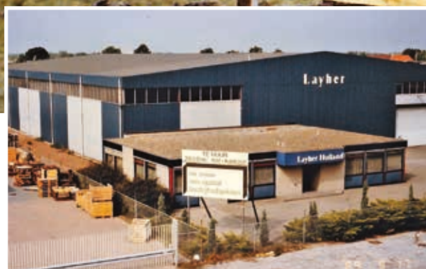
De eerste locatie Lissenveld 13 in Raamsdonksveer

Het slaan van de eerste paal op de locatie Lissenveld 18, van waaruit we nog steeds werken.