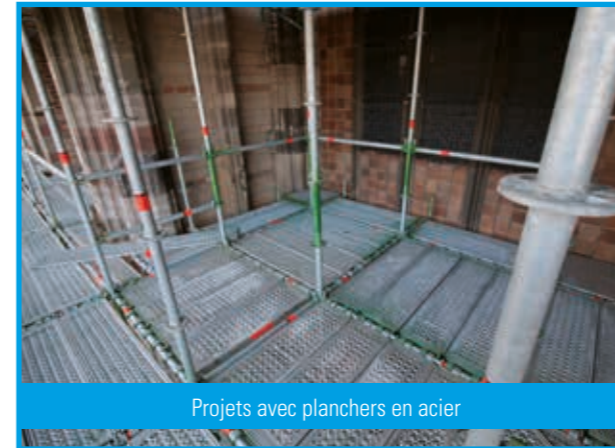
Projets avec planchers en acier