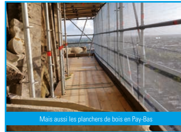
Mais aussi les planchers de bois en Pay-Bas