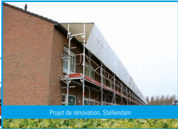
Projet de rénovation, Stellendam