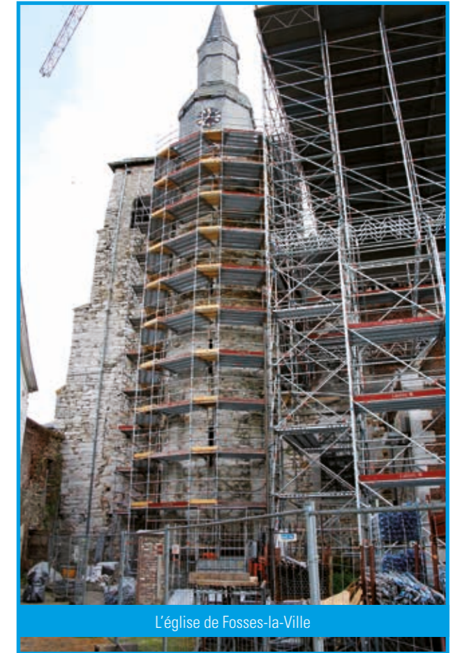
L'église de Fosses-la-Ville