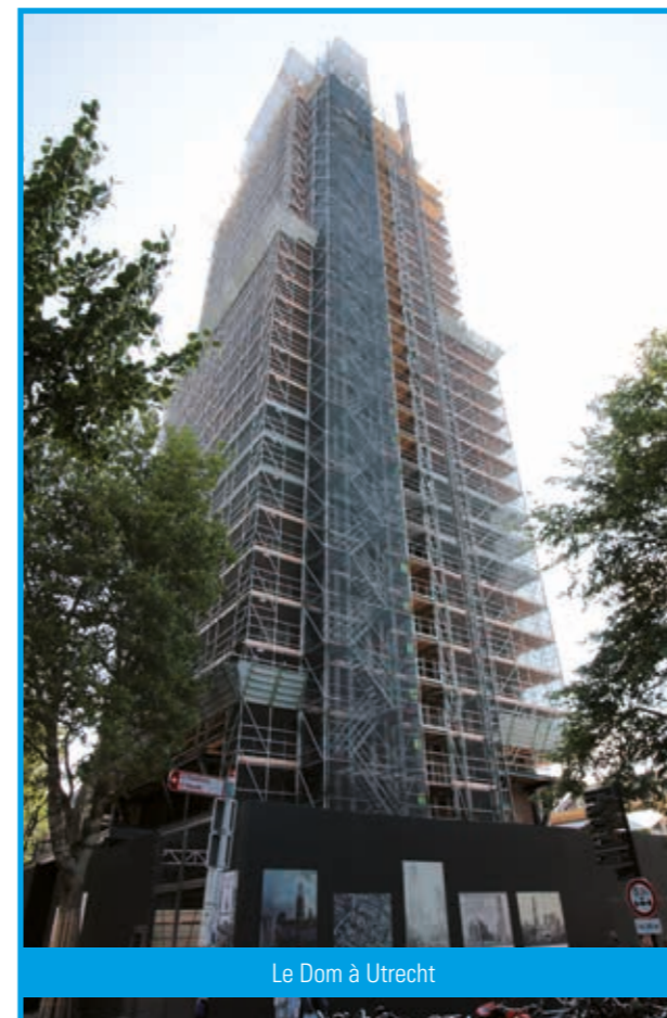
Le Dom à Utrecht