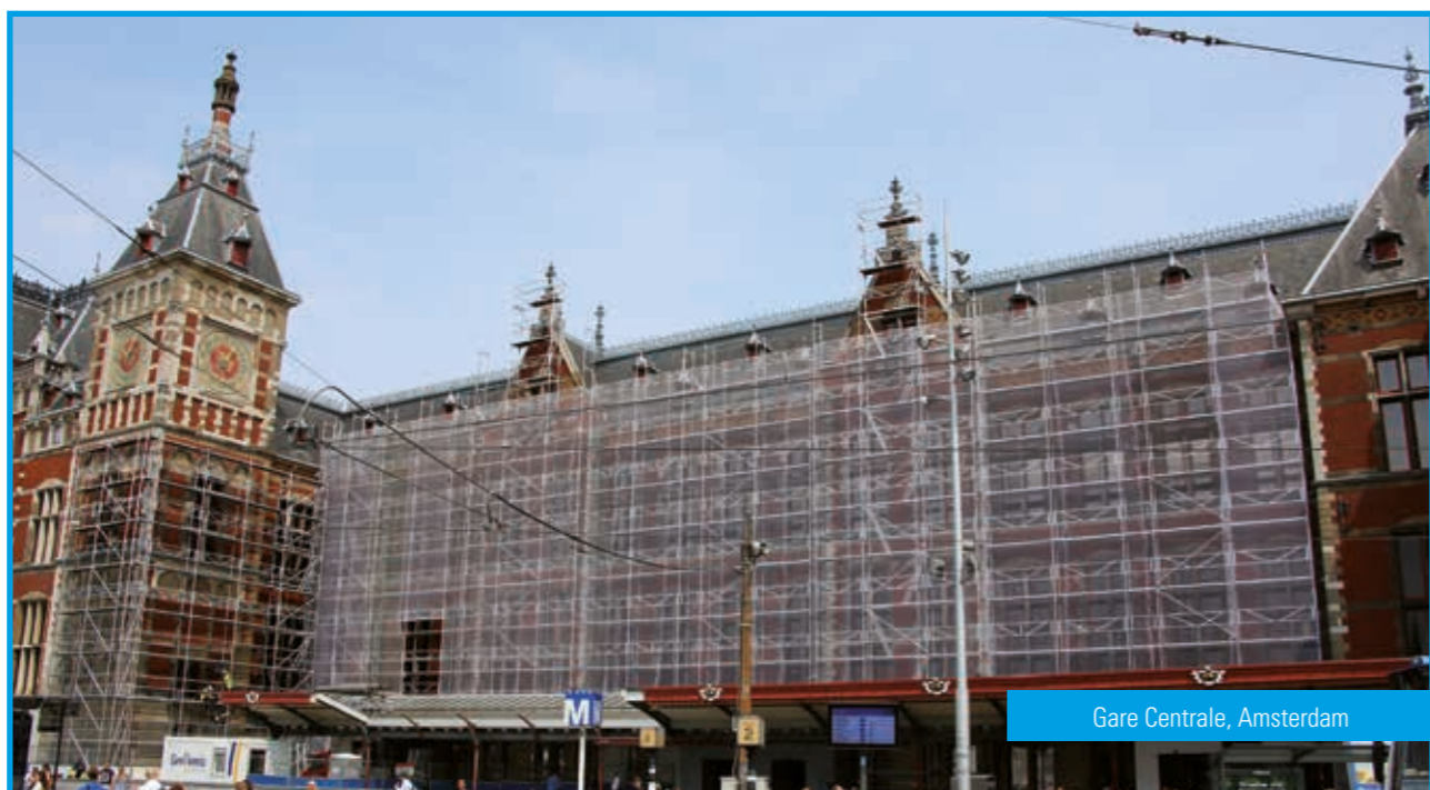
Gare Centrale, Amsterdam

Sur cette page, nous vous présentons différents projets de restauration de bâtiments historiques ayant largement utilisé le système Allround et Blitz. De nombreux chantiers de rénovation utilisent des installations d'échafaudages Blitz, parfois avec un système de protection.