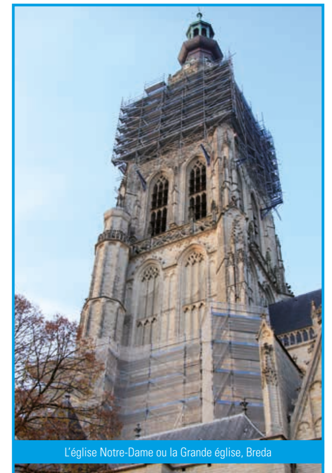
L'église Notre-Dame ou la Grande église, Breda