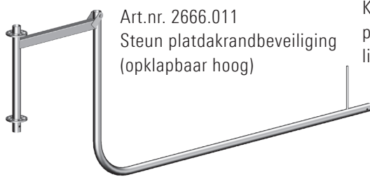
Art.nr. 2666.011 Steun platdakrandbeveiliging (opklapbaar hoog)