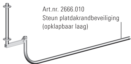
Art.nr. 2666.010 Steun platdakrandbeveiliging (opklapbaar laag)

Ballastblokken voorkomen het kantelen van de dakrand-leuningstaanders.