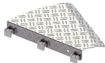
Planchers d'étanchéité coin, no.d'article 3868.000