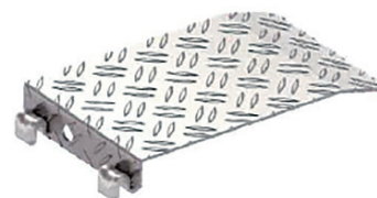
Planchers d'étanchéité zones de compensations no.d'article 3868.032