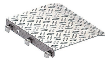
Planchers d'étanchéité zones de compensations no.d'article 3868.061